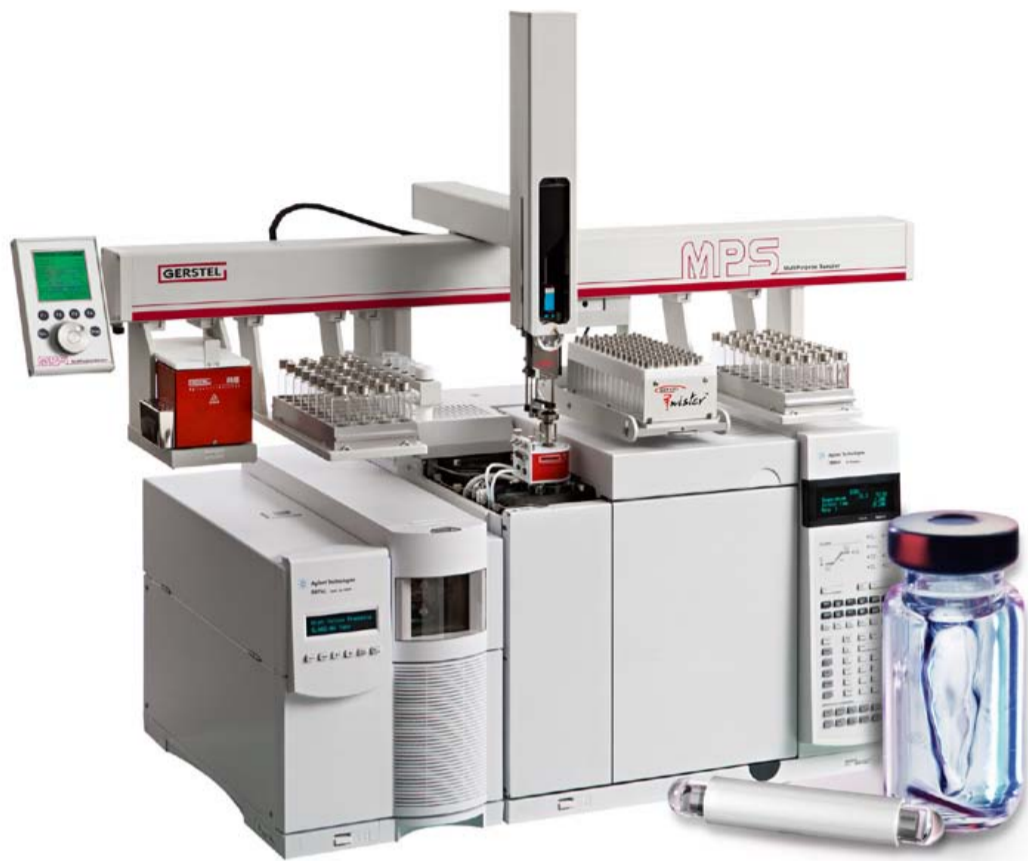
Multi Purpose Sampler MPS für die vollautomatisierte Probenvorbereitung und -aufgabe in der Gas-Chromatographie.