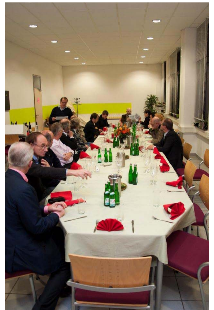
Sommeliers und Techniker gemeinsam an einem Tisch zum Thema „Weinanalytik“.

Wein ist und bleibt trotz aller chemisch-technischen Analyse, trotz Super-Nasen, Power-Papillen und Killer-Gaumen der besten Sommeliers ein nie ganz zu ergründendes Mysterium. Und das ist vielleicht ganz gut so. Denn wenn auch das letzte Geheimnis gelüftet wäre – was bliebe dann noch? Wie sagte Oscar Wilde, gewiss auch ein Liebhaber guter Weine: „Schöner, als die Wurzeln einer Rose unters Mikroskop zu legen ist es, sich an ihrer Blüte zu erfreuen.“